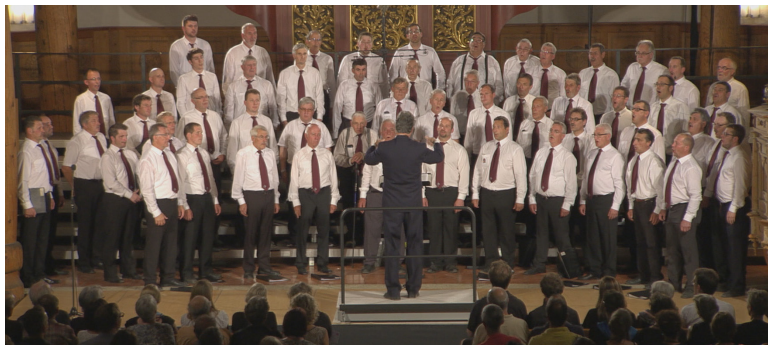
Fotografia fatga a caschung dalla festa federala da cant ainten la baselgia da s. Mitgel a Meiringen igls 13 da zarcladour 2015*